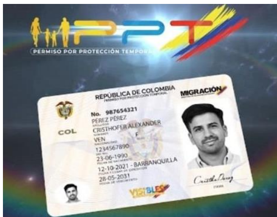
Ilustración PPT Permiso por protección temporal

Adicional a lo anterior, y atendiendo la situación excepcional de los migrantes de nacionalidad venezolana, estos extranjeros podrán acreditar domicilio con el PPT contemplado en el Decreto 216 de 2021 9 y el Permiso Especial de Permanencia.