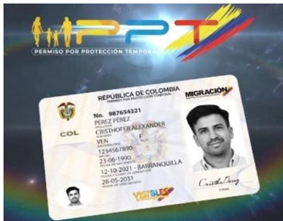
Permiso por Protección Temporal – PPT Ilustración 10

En todo caso, al tratarse de una situación especial de los niños y niñas nacidos en Colombia que se encuentran en riesgo de apátrida, hijos de padres venezolanos, en concordancia con la Resolución 8470 de 2019 (modificada posteriormente por la Resolución 8617 de 2021), se podrán identificar también con el Permiso por Protección Temporal – PPT (ver ilustración) y la Cédula de Identidad expedida por la República Bolivariana de Venezuela, teniendo en cuenta que debe haber concordancia entre el documento que aporta y el constatado en el Registro Civil del menor a través de la verificación en el aplicativo SES.